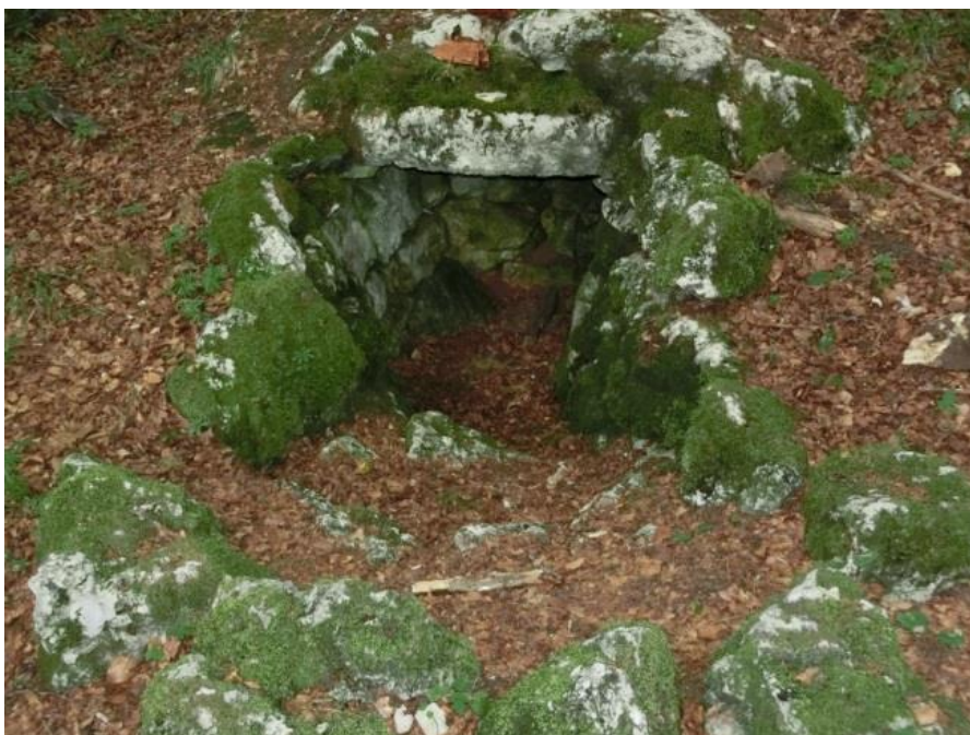
Gemauerter Vorratskeller

Innerhalb der noch erkennbaren Einfriedung der Siedlungsstelle wurde eine ausgemauerte Erdhöhle entdeckt, die vom Landesdenkmalamt hilfsweise als Erdkeller bezeichnet wurden. Bei genauerem Hinsehen sind mehrere Bodenvertiefungen gleichen Ausmaßes in einer Linie auf beiden Seiten des sogenannten Kellers erkennbar, die auf eine kleine Hofbegräbnisstätte hinweisen. Im Vorratskeller fand sich beim Ausräumen von Laub und Humus auf dem Boden liegend ein Plattenstück aus „Stubensandstein“ mit einem eingeschlagenen griechischen Altarkreuz. Ob diese Ausstattung nach der Christianisierung ab 600 n. Chr. erfolgte ist ungewiss. Die Frage bleibt, ob dies ein Hinweis auf eine Grabkapelle sein könnte, die es in früheren Zeiten gab. Der Zugang zur Grube ist mit Stufen aus Stein ausgelegt und vor der ersten Stufe befindet sich ein Steinkranz als Zierde.