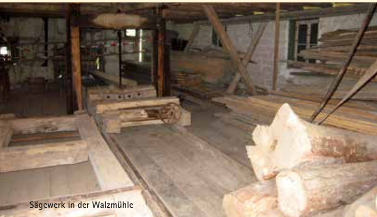
Sägewerk in der Walzmühle