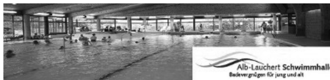
Alb-Lauchert-Schwimmhalle Badevergnügen für jung und alt

Die in Gammertingen angekommenen Kriegsflüchtlinge aus der Ukraine treffen sich wöchentlich am Dienstag von 14.00 Uhr bis 16.00 Uhr im Fidelishaus. Wenn Sie uns unterstützen wollen, freuen wir uns über eine Spende oder ihre persönliche Unterstützung für eventuelle Fahrdienste, persönliche Patenschaften, etc. Bitte wenden Sie sich an Matthias Kopp 0173/3001174