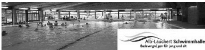
Alb-Lauchert Schwimmhalle Badevergnügen für jung und alt

(Kenntnisnahme bis zum Redaktionsschluss des Amtsblattes am Montagabend – bitte beachten Sie hier auch unsere „News“ unter: www.gammertingen.de )